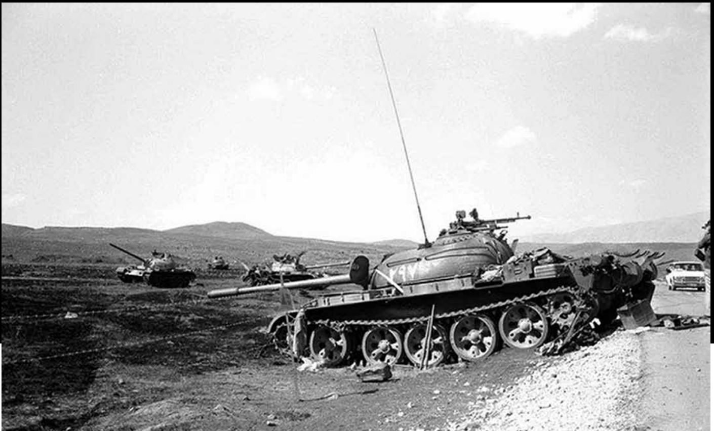
טנקים סורים פגועים ברמת הגולן

ביום שקדם למלחמה. כל שיכול עתה לעשות היה לשבש את המתקפות היבשתיות על ידי הכוחות הסדירים וחיל האוויר, עד להגעת כוחות המילואים, תוך 72 שעות לסיני ותוך 36 שעות לגולן.