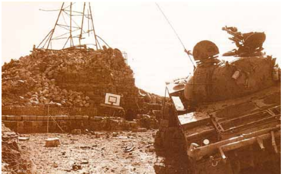
סנקי סורי שנבלם על גדר אחד המוצבים במלחמת יום הכיפורים (מתוך הספר "בני קשת" בעריכת חני זיו ויואב גלבר)

בינתיים זרמו כוחות נוספים לרמה. אל גדוד 278 שנלחם במצור אל על חברה בשעה 14:00 חטיבה ממוכנת 9 בפיקוד אל"ם (במיל') מוטק'ה בן פורת עם גדוד טנקי "שרמן" אס-51, שכלל 47 טנקים. אל חטיבה 179 בקצביה הצטרפו פלוגה