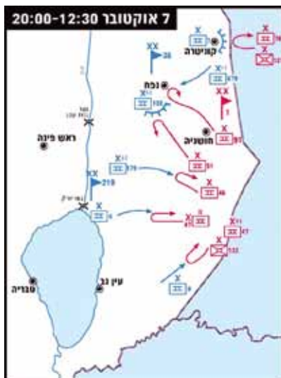
מצב הכוחות ברמת הגולן בליל 6-7 באוקטובר 1973 בשעות 12:30 - 20:00

מח"ט 7 לא הורה למג"ד 82 לעבור תחת פיקוד מח"ט 188, וכל פקודה למג"ד ניתנה בתיווכו. רק בערב העביר מג"ד 82 את רשת הקשר שלו לזו של מח"ט 188. הייתה פלוגה של גדוד 82 שנכנסה לקרב רק לאחר חשיכה ודוקא זו כללה תותחנים שלא התנסו בירי בלילה אפילו של כדור אחד, לפני המלחמה.