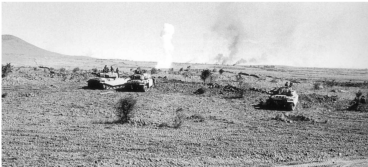
התקדמות כוחות פיקוד הצפון במלחמת יום הכיפורים (מתוך הספר המאבק לביטחון ישראל בעריכת אל"ם במיל' בני מיכלסון, סא"ל במיל' אברהם זהר וסא"ל במיל' אפי מלצר)

הציג אותה אותה קמ"ן פיקוד הצפון שייע בר מסדה, במסגרת דיון בתכניות המגננה בגולן. התכנית הסורית "משרוע 110" הייתה לתקוף ח"ר, מתוגברות בחטיבת טנקים נוספת לכל דיוויזיה. בשלב זה שיימשך 5 שעות, לא יהיה מאמץ עיקרי. לאחר 5 שעות יוכנסו דיוויזיות השריון לתוך הגולן, דרך המרחב שייכבש בשלב הראשון, ויכבשו את הגולן עד לירדן, שייפסס כבר בשלב הראשון על ידי כוחות קומנדו מונחתים ממסוקים. שעת ה"ט" הייתה 18:00. הסורים הניחו שמולם יהיה כוח צה"ל, כפי שאכן היה במלחמה, דהיינו לא יותר מ-200 טנקים, וכן כי עוצבות המילואים לא יגיעו לרמה לפני כיבושה על ידי הסורים.