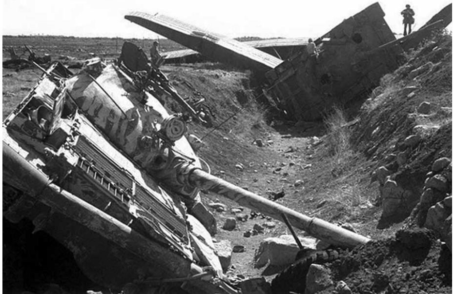
טנקים סורים פגועים בתעלת הנ"ט ברמת הגולן

למרות שהתכנית הסורית לא קבעה כל מאמץ עיקרי בשעות הראשונות, חיפש מטה הפיקוד וכן המטכ"ל את קיומו של מאמץ כזה. עם תחילת המלחמה הורה מפקד הגולן, יצחק בן שהם, נאמן להנחיות אלוף הפיקוד, לכוחות שלו בקו לבצע את פקודת "קפיטל", לפיה יתוגבר קו המוצבים במחלקות טנקים, תוך השארת פלוגת טנקים בעתודה בכל גזרה. פקודת "קפיטל" הינה דומה למקרה של מלחמה ולמקרה של "יום קרב". נאמן להנחיות אלוף הפיקוד הוא גם הורה למח"ט 7 בשעה 14:35 לשלוח גדוד טנקים אחד למרום הגולן, גדוד שני לחושניה ולהשאיר גדוד אחד ב"עגבנייה" (צומת נפח).