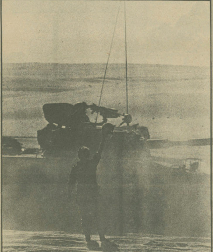
„יהיה בסדר“ — אמרו בקשר — „הטנקים בדרך“