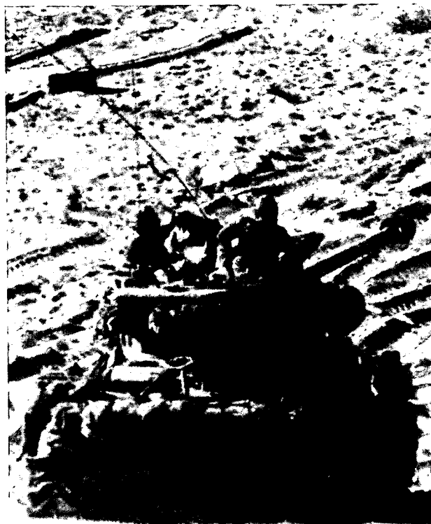
טנק שרמן משופר בבלימת ההתקפה המצרית

בעניין זה מספר הרצוג בספרו (בהסתמך על דברי שבוים), ששאולי סיכם את קרב ה-14 באוקטובר באמרו, כי כשם שהישראלים סבלו את עיקר אבידותיהם בטנקים ב-6 באוקטובר מטילים נ"ט מצריים, כך סבלו המצרים את עיקר אבידותיהם בטנקים ב-14 באוקטובר מטילים נ"ט ישראלים. על כך מוסיף גמסי (בהרצאתו למפקדים שכבר הוזכרה), שהמדובר בטילים נ"ט אמריקניים. רוצה לומר: לא הישראלים הכריעו את הקרב אלא "המעורבות האמריקנית". לדבריו "במהלך הקרבות ב-14 באוקטובר סבלו הטנקים המצריים אבידות כבדות מנשק נ"ט ומטנקים שהופיעו פתאום ברשות האויב. התברר כי הנשק האמריקני הגיע ישירות לאל-עריש ולשדות התעופה בסיני..." גמסי מספר על ציוד אמריקני (כולל טנקים) שהתערב בקרב