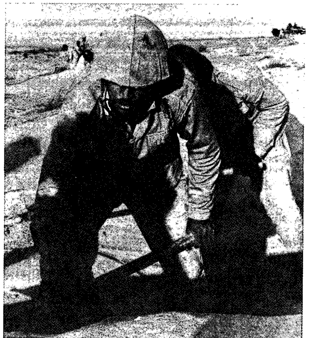
חייל מצרי מתחפר במהלך השלב הראשון של המלחמה

19. הסיפור על "הנשק המהפכני" האמריקני שהשתתף בקרב חוזר ונשנה במספר מקורות. אין לכך, כמוכּוּן, כל יסוד. הרכבת האווירית האמריקנית החלה, כאמור, לפעול בליל 13—14 אוקטובר, ומטוסי הענק האמריקניים הראשונים נחתו בלוד בסיומו של הקרב. אמנם מטוסי "אל-על" הביאו ציוד לחימה עוד קודם לכן, בכללו טילים נ"ט אישיים מסוג "לאו", אך למעט גודד צנחנים אחד, אשר לו נועד סוג נשק זה, התנהלה הלחימה בכוחות המצריים התוקפים על-ידי כוחות השריון של צה"ל.