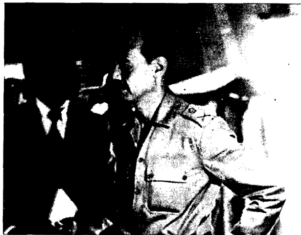
הגנרל גמסי ר' אג"מ במטכ"ל המצרי

מסיבות מובנות הפחית סאדאת מערך הרכבת האווירית הסובייטית שהחלה לפעול בליל 9-10 באוקטובר (למרות שאפילו מקורות ערביים ניטרליים, כמו "אלג'ומהוריה" הלב-נוני מה-10 באוקטובר 1974, קבעו כי במשך המלחמה קיבלו סוריה ומצרים מברה"מ כ-65 אלף טון נשק וציוד, מתוכו — כ-15 אלף טון באוויר), אולם ניתן להניח כי עצם הפעלתה של הרכבת האווירית, תוך מתן עדיפות למילוי צרכיה של סוריה, גרמה לסאדאת, ובמיוחד לשר הצבא איסמעיל, לסטות מהערכה, לפיה לא תחזיק סוריה מעמד ועל-כן עלול צה"ל להתפנות ולהכות במצרים. מכאן ואילך לא היה למצרים טעם להמשיך ולהתעקש על חיזוק ההיערכות למגננה ונתחזקה, אפוא, המגמה לעבור ל"מתקפה".