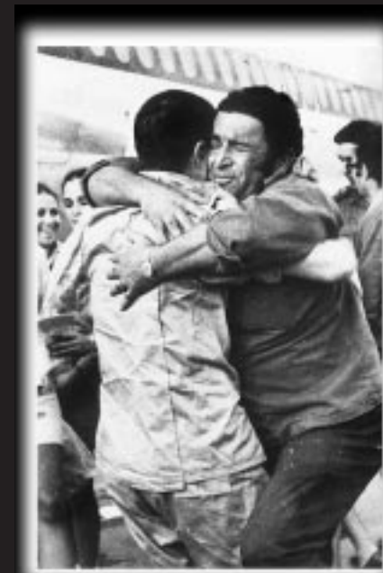
ההתרגשות: קבלת פנים לשבויים בלוד

הם קשרו לנו את הידיים לאחור, ואחד החיילים שם מצביע לעבר ערימת הגויות ואומר לנו: 'אתם הולכים לשם'. סובכו אותנו עם העיניים פתוחות לעבר הקיר, והבנתי שבכל רגע אנחנו צריכים לקבל כדור