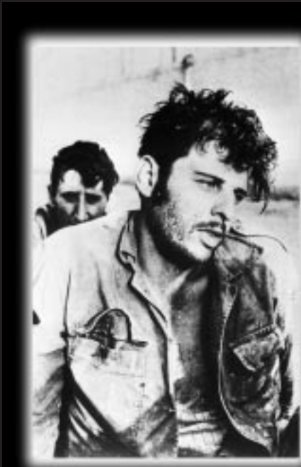
פני המלחמה: שבוי ישראלי במצרים

בחקירות בזכרון-יעקב רמזו לנו שלא לחמנו נכון, שלא בסדר שנכנענו, נתנו לנו את התחושה שלא תיפקדו כמו שצריך, שאנחנו מצורעים, כאילו כל המחל הנורא הזה אירע בגלגולנו