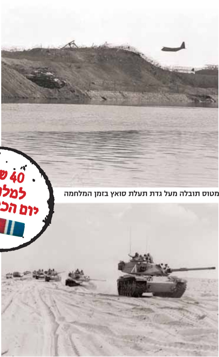
מטוס תובלה מעל גדת תעלת סואץ בזמן המלחמה