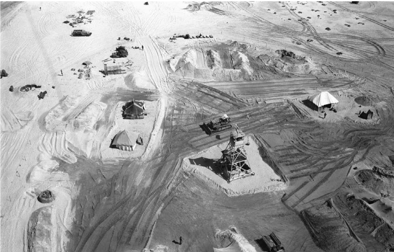
קו המעוזים ליד תעלת סואץ. רשף ושרון פעלו בקדחתנות להוציא לפועל תוכנית לחילוץ הכוחות שנקלעו למצוקה