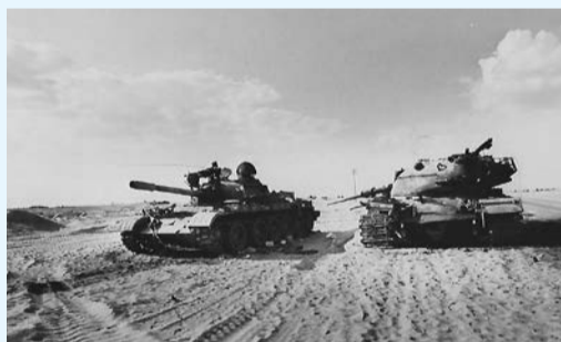
טנק ישראלי (מימין) וטנק מצרי ב"חווה הסינית"

ייעודו של גדוד הסיור היה לעמוד בראש הכוח. לאחר שרשף דיווח להם על ההתפתחויות החיוביות ברמת הגולן ובסיני הוא חיזק את ידיהם ואמר: "אתמול כתשנו