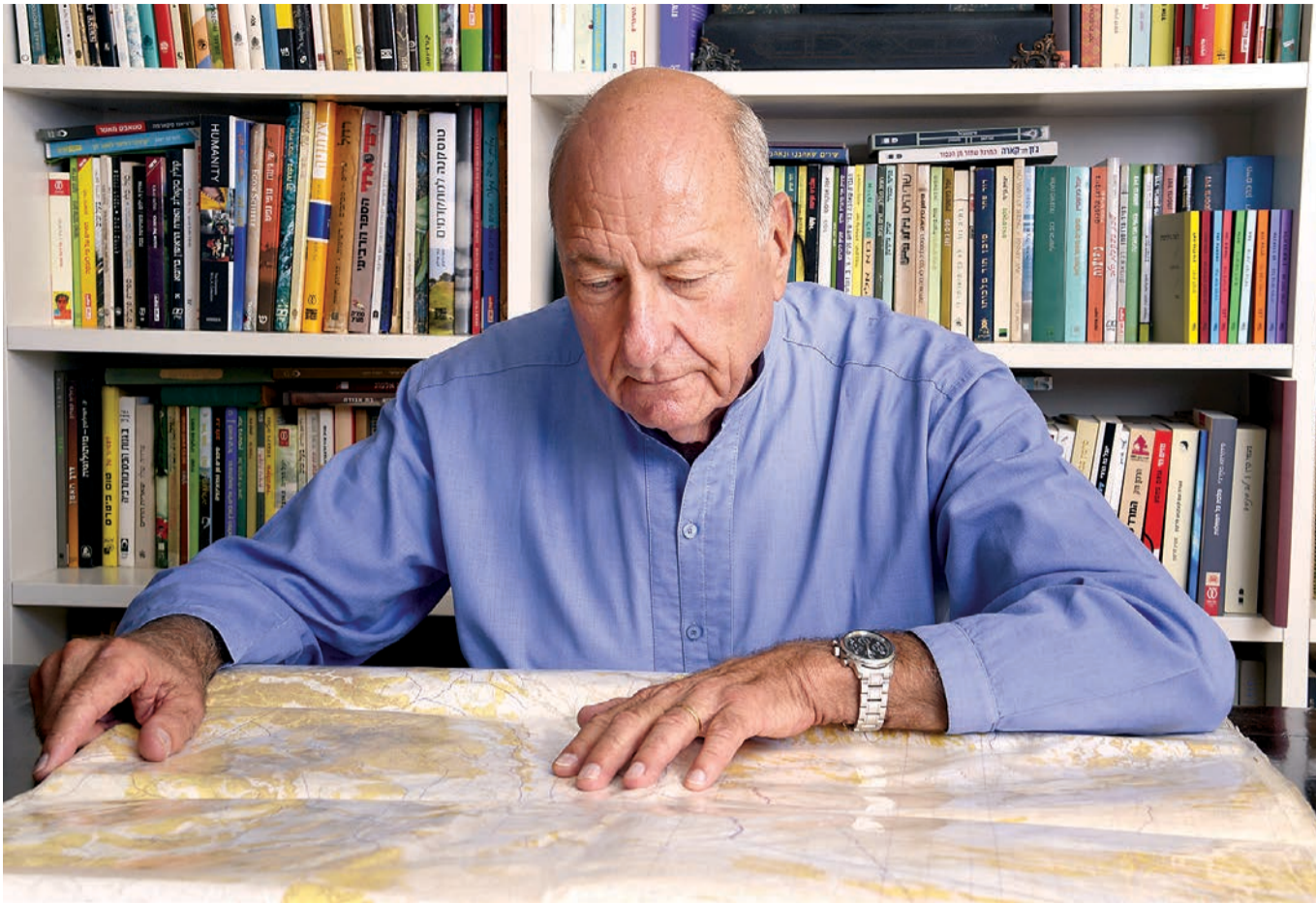
"היה מרגש לראות את החיילים הפצועים בבית החולים עונדים את תג החטיבה על הפיג'מה". רשף